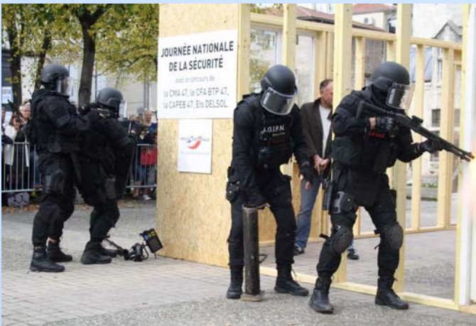
Le GIPN en action : simulation d'une prise d'otages